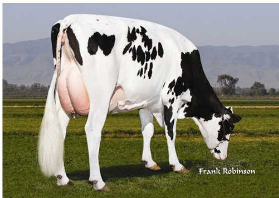
HILLTOP BOWMAN 9422